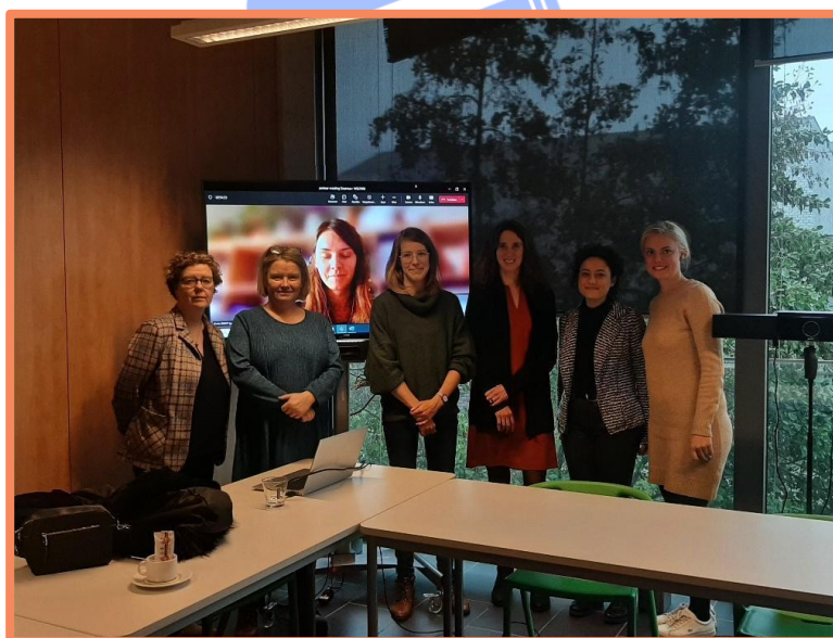
Φωτογραφία από τη διακρατική συνάντηση των εταίρων στο Kortrijk

Το Νοέμβριο του 2022, οι εταίροι του ευρωπαϊκού προγράμματος WELFARE – ΚΜΟΠ – Κέντρο Κοινωνικής Δράσης και Καινοτομίας (Ελλάδα), Vaxandi - Háskóli Íslands (Ισλανδία), Stimmuli (Ελλάδα), XWHY / Agency of Understanding (Λιθουανία) και VIVES (Βέλγιο) – συναντήθηκαν για πρώτη φορά δια ζώσης. Η VIVES υποδέχτηκε όλους τους εταίρους στην πανεπιστημιούπολή της, στην όμορφη πόλη Kortrijk του Βελγίου, για να συζητήσουν τα μέχρι τώρα αποτελέσματα του έργου, τα επόμενα βήματα, καθώς και ορισμένες καινοτόμες τοπικές, κοινωνικές πρωτοβουλίες (De Stuyverij and DURFBAR). Στη συνάντηση συζητήθηκε επίσης η έκθεση εντοπισμού ελλείψεων (Gap Analysis), ενώ συγκεντρώθηκαν και οι απαραίτητες πληροφορίες για την περαιτέρω ανάπτυξη του προγράμματος σπουδών, των ανοικτών εκπαιδευτικών πόρων και της πλατφόρμας κατάρτισης και επικοινωνίας.