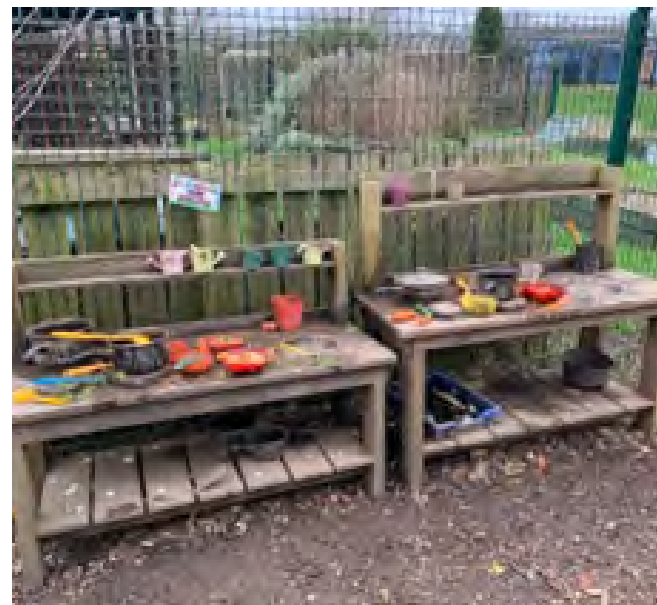
[Εικόνα 1: επιλογή φωτογραφιών από τον χώρο του Forest School του Δημοτικού Σχολείου Carlton Grange]