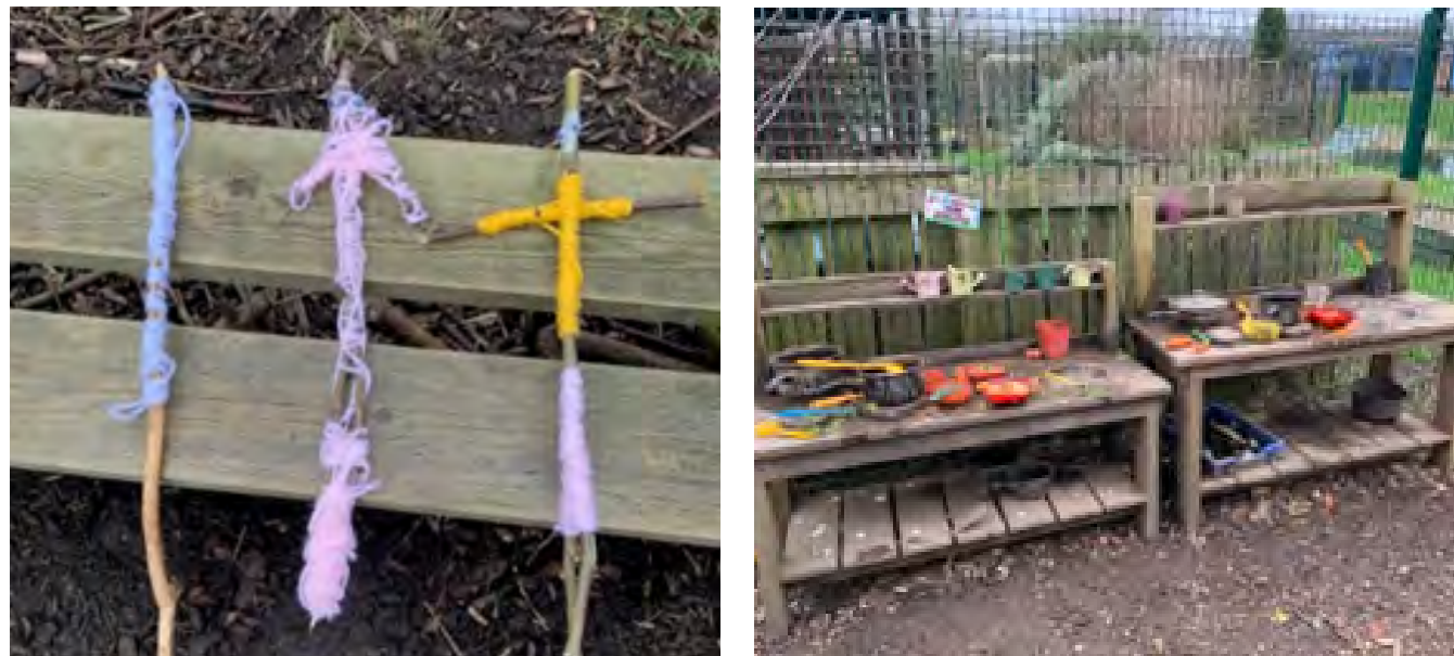
[Εικόνα 1: επιλογή φωτογραφιών από τον χώρο του Forest School του Δημοτικού Σχολείου Carlton Grange]

Το δημοτικό σχολείο Carlton Grange έχει αναπτύξει μια περιοχή του σχολικού γηπέδου με δέντρα σε χώρο του Forest School, ο οποίος περιλαμβάνει τώρα μια περιοχή για άναμμα φωτιάς, πολλά χαλαρά μέρη με κορμούς, κλαδιά και κλαριά διαφόρων μεγεθών, μια περιοχή για σκάψιμο, σταθερούς κορμούς και ένα χαλαρωμένο σχοινί στο έδαφος για ισορροπία, μια αιώρα, μια περιοχή για «μαγικά» φίλτρα και μια κουζίνα εξωτερικού χώρου. Ο χώρος περιλαμβάνει επίσης μια έκταση για καλλιέργεια και μια λίμνη άγριας ζωής.